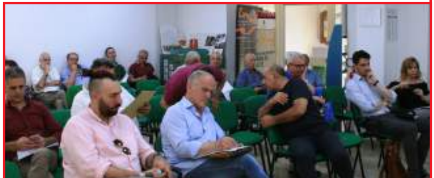
Parte del pubblico presente in sala

locali e la realizzazione di un'officina digitale. Proposte inoltre misure mirate ad attirare nuovi residenti sia italiani che stranieri sul territorio. Tra gli altri argomenti trattati la creazione di una certificazione ambientale e di una piattaforma social. La presentazione del Preliminare è stata seguita da un vivace dibattito tra i rappresentanti comunali presenti, che con i loro interventi hanno proposto modifiche e integrazioni. "La parte più impegnativa inizia da adesso - ha dichiarato il Presidente Romanzi - ma occorre andare avanti con positività, coinvolgendo sempre più persone. Questi territori sono il centro del mondo, unici nelle loro peculiarità. È nostro dovere realizzarne al meglio l'enorme potenziale"