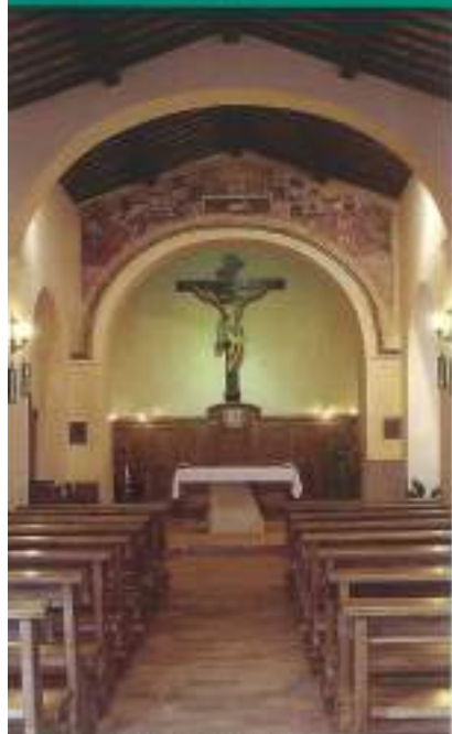
La navata della chiesa conventuale

La chiesa – navata unica con cappelle da ambo i lati – molto semplice, nitida, armoniosa, tipicamente francescana, non presenta importanti opere artistiche; la vera ricchezza di questa chiesa è il raccoglimento e il clima di santità che essa offre ai numerosi pellegrini.