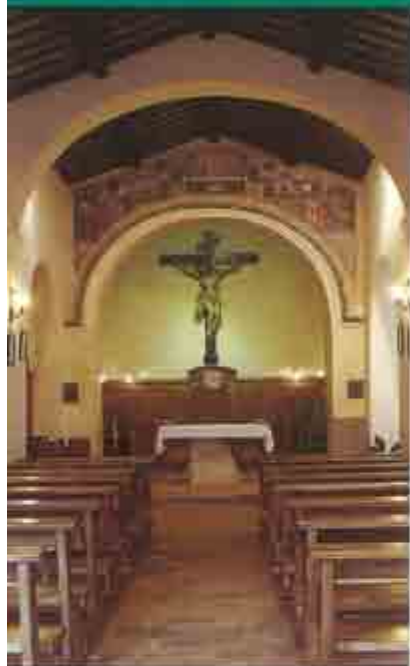
La navata della chiesa conventuale

La chiesa – navata unica con cappelle da ambo i lati – molto semplice, nitida, armoniosa, tipicamente francescana, non presenta importanti opere artistiche; la vera ricchezza di questa chiesa è il raccoglimento e il clima di santità che essa offre ai numerosi pellegrini.