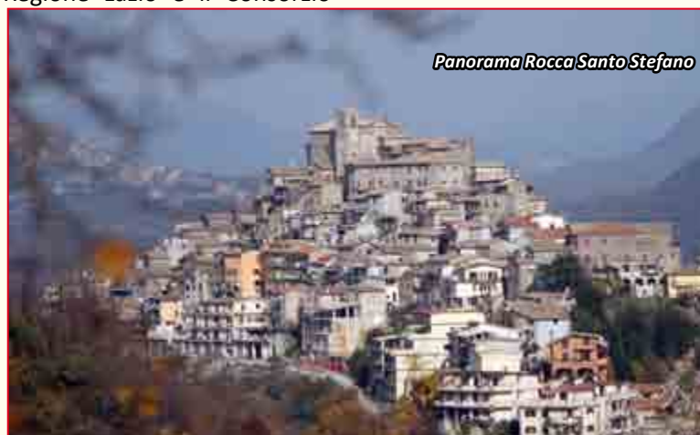
Panorama Rocca Santo Stefano

“Abbiamo aggiunto un nuovo segmento alla nostra raccolta differenziata – ha concluso il Sindaco – questa iniziativa non solo contribuisce alla tutela ambientale ma permetterà col tempo di migliorare la differenziazione e il riciclo dei rifiuti”