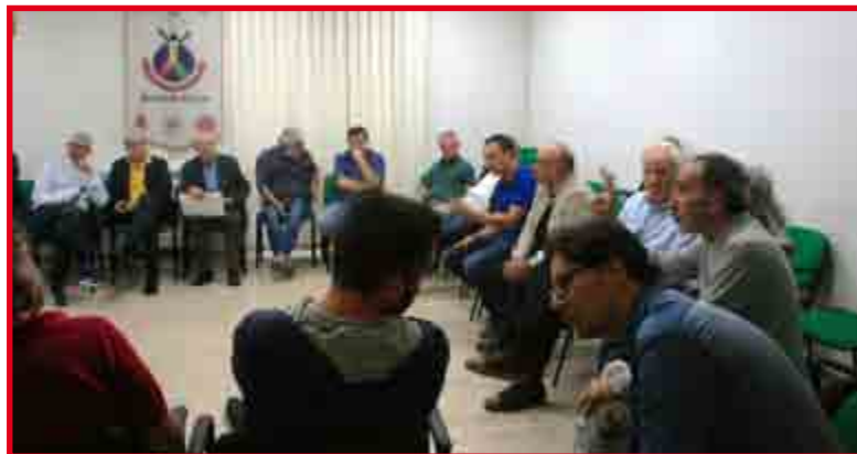
Alcuni Sindaci dei Comuni di Aree Interne

ribadito l'importanza di prestare attenzione ai piccoli comuni, esprimendo la necessità di non lasciare nessuno indietro: “C'è stato un lavoro di pianificazione importante, la gente comune è venuta a dirci la propria opinione, cosa funziona e cosa non funziona. Ora bisogna procedere tutti uniti, senza abbandonare nessuno, e iniziare a pensare anche ai piccoli comuni non direttamente coinvolti in Aree Interne”