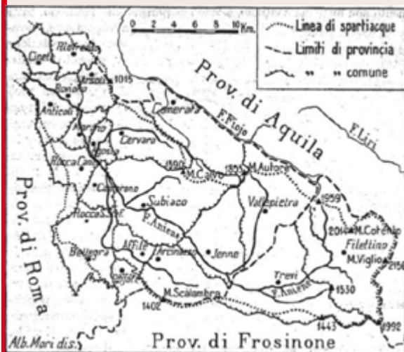
Fig. 1 – Confine fisico e limiti amministrativi dell'Alta Valle dell'Aniene, secondo Alberto Mori.

Generalmente per Valle dell'Aniene si intende il territorio prevalentemente montano posto ai margini orientali della Città Metropolitana di Roma Capitale, ai confini con l'Abruzzo. L'assenza del toponimo "Valle dell'Aniene" nella cartografia ufficiale fa sì che questo territorio si configuri di fatto come «un vuoto assoluto, sospeso tra i Monti Simbruini,