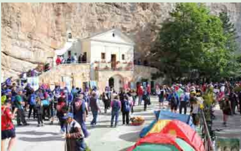
Sullo sfondo il Santuario della SS. Trinità a Vallepietra

Cardinale Ruini che anche quest'anno è venuto a Vallepietra, ai campioni dello sport e ai divi dello spettacolo che amano confondersi tra i pellegrini comuni, il Santuario accoglie anche tanti turisti e semplici visitatori. "Vengono qui perché tappa di escursioni al monte Autore o nei sentieri circostanti e tutti restano rapiti non solo dalla bellezza del luogo, ma anche dai fedeli e da questa devozione autentica. Un po' iniziano a convertirsi anche loro", aggiunge don Alberto. Accogliere quasi mezzo milione di persone nei