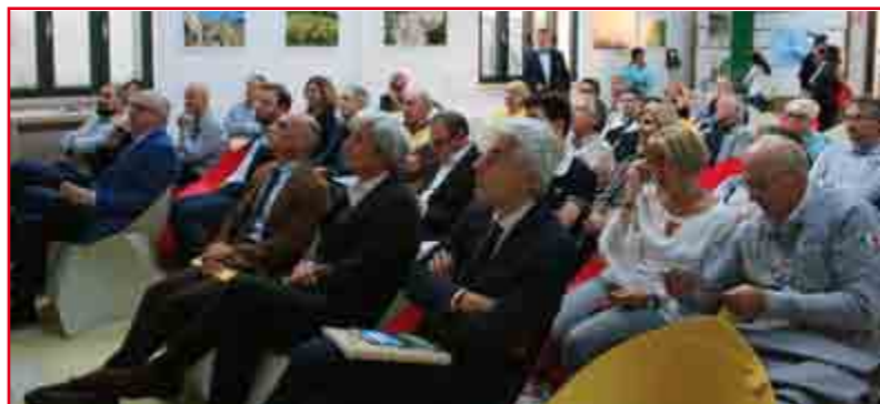
Parte del pubblico presente

La linea ferroviaria Roma - Napoli (via Cassino) ha come stazione più vicina al Parco quella di Anagni, da qui partono i mezzi CO.TRA.L. per alcuni paesi del Parco.