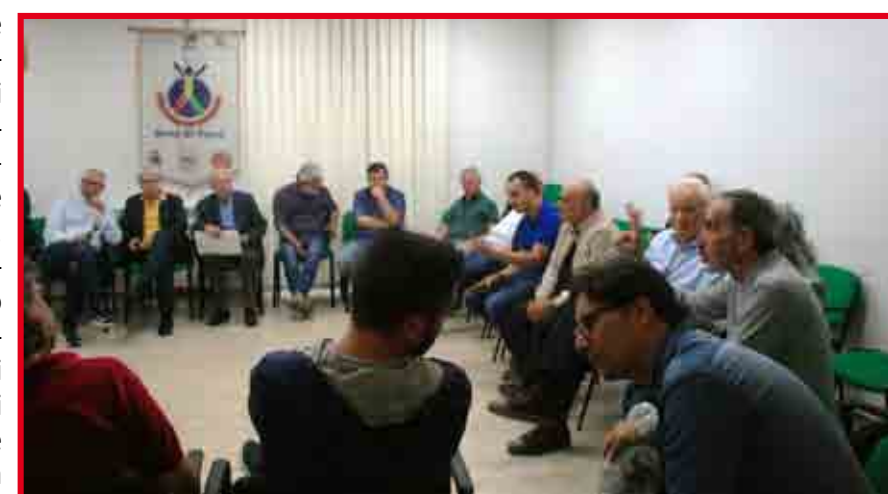
Alcuni Sindaci dei Comuni di Aree Interne

sentato proposte e istanze al tavolo tecnico. Il preliminare di strategia è stato invece approvato e trasmesso alla Regione Lazio a fine Giugno. All'invio del preliminare ha fatto seguito un nuovo e recente ciclo di incontri presso la sede di Madonna della Pace della X Comunità Montana dell'Anie-