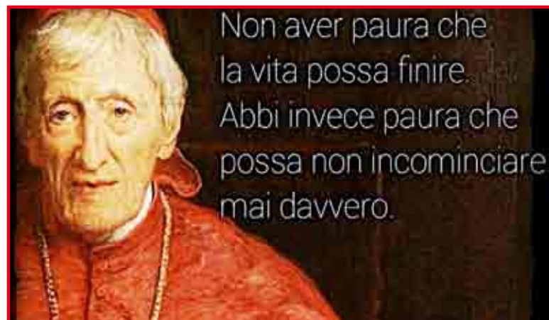
John Henry Newman

Il Signore vi dia la sua Pace e ogni bene.