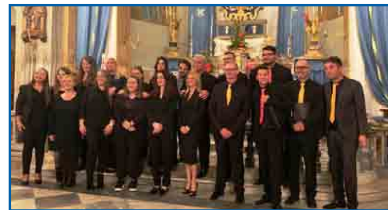
MusiChorum il nuovo coro polifonico di Gavignano

fino al corale bachiano O Haupt voll Blut und Wunden , passando per le colonne sonore di Armando Trovajoli, la canzone romanesca e il brano Dolcenera di Fabrizio De