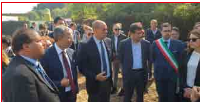
Bonifica Colleferro Valle del sacco

non sia solo una bonifica ma il primo tassello di rinascita di questa parte bellissima del Lazio". Il ministro Costa ha voluto sottolineare che "mi piace che per la Valle del Sacco la Regione, un privato e il ministero siano uniti da un percorso assieme. Abbiamo messo al centro il benessere dei cittadini. Quando abbiamo firmato l'accordo di programma per la bonifica di Val-