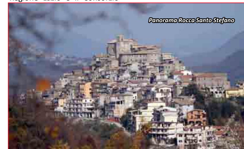
Panorama Rocca Santo Stefano

"Abbiamo aggiunto un nuovo segmento alla nostra raccolta differenziata - ha concluso il Sindaco - questa iniziativa non solo contribuisce alla tutela ambientale ma permetterà col tempo di migliorare la differenziazione e il riciclo dei rifiuti"